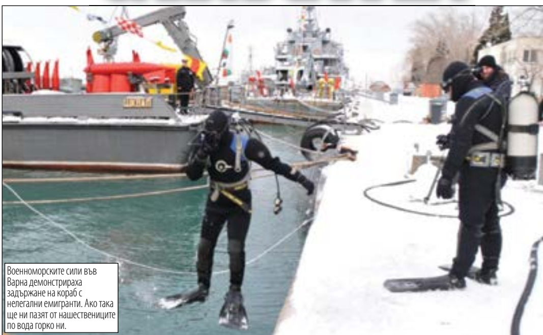
Военноморските сили във Варна демонстрираха задържане на кораб с нелегални емигранти. Ако така ще ни пазят от нашествениците по вода горко ни.