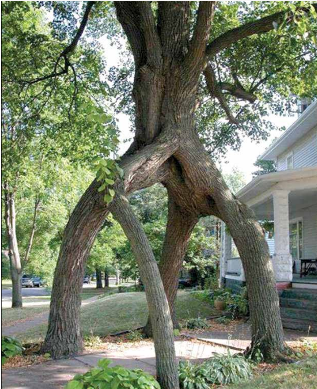
Уникалното дърво събира погледите на всички минавачи със своята причудлива форма и за пореден път доказва твърдението, че природата е най-добрият художник.