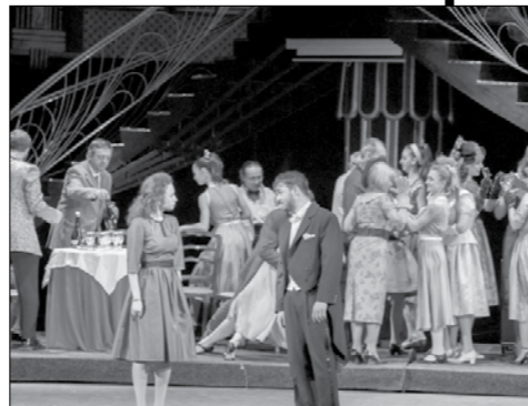
номаните от едноименния филм на Били Уайлдър, който е удостоен с 11 номинации и 3 награди Оскар.

Премиерата предизвика истински фурор в препълнената зала на Държавния музикален театър Стефан Македонски. Мюзикълът на гениалния Андрю Лойд Уебър, който печели три награди Тони, включително и за мюзикъл на годината, бе представен за първи път на българска сцена. Сюжетът му е добре познат на ки-