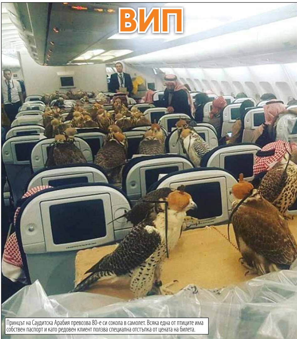
Принцът на Саудитска Арабия превозва 80-е си сокола в самолет. Всяка една от птиците има собствен паспорт и като редовен клиент ползва специална отстъпка от цената на билета.

- Урааа! Она чичко, с мустаците, пак ще ми донесе шоколад!