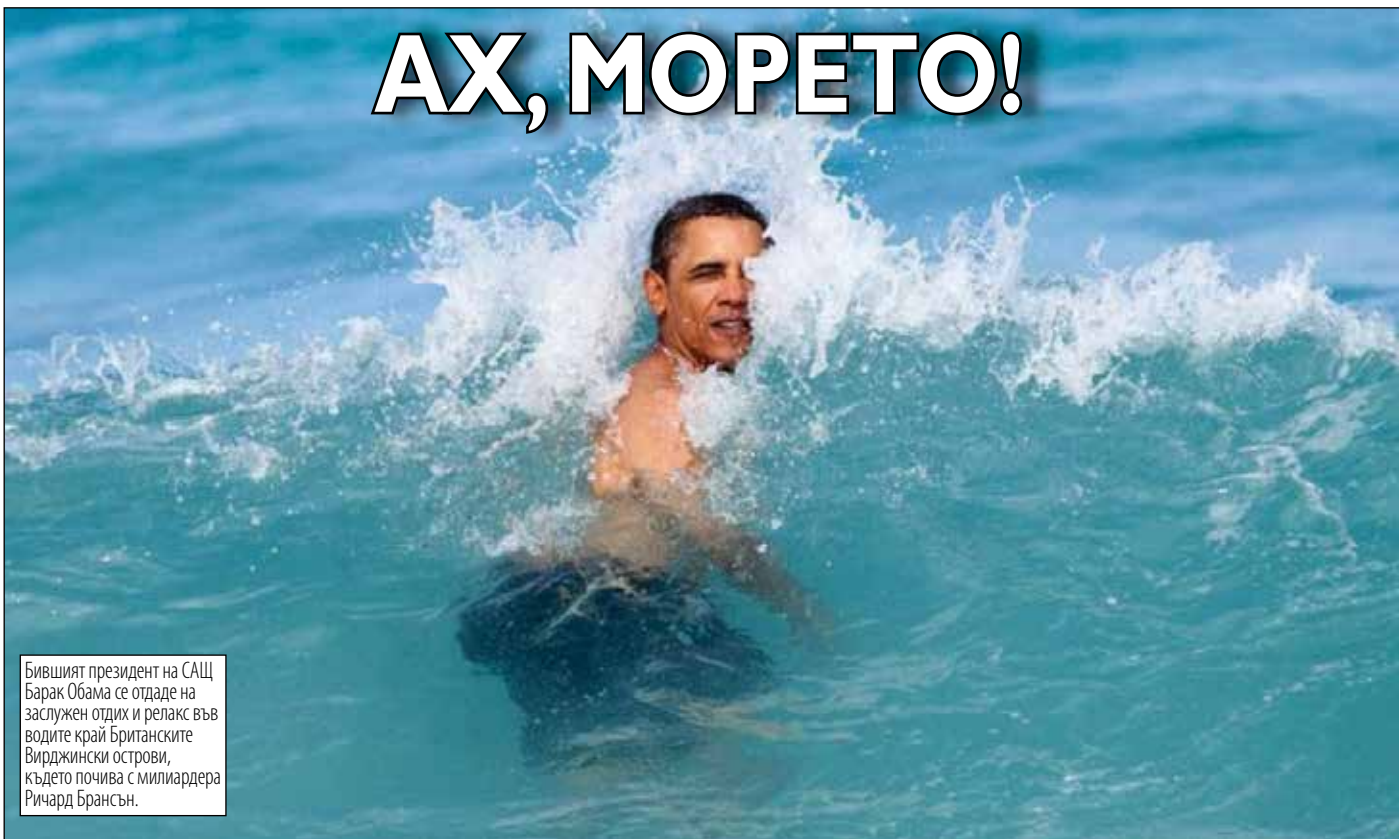
Бившият президент на САЩ Барак Обама се отдаде на заслужен отдих и релакс във водите край Британските Вирджински острови, където почива с милиардера Ричард Брансън.