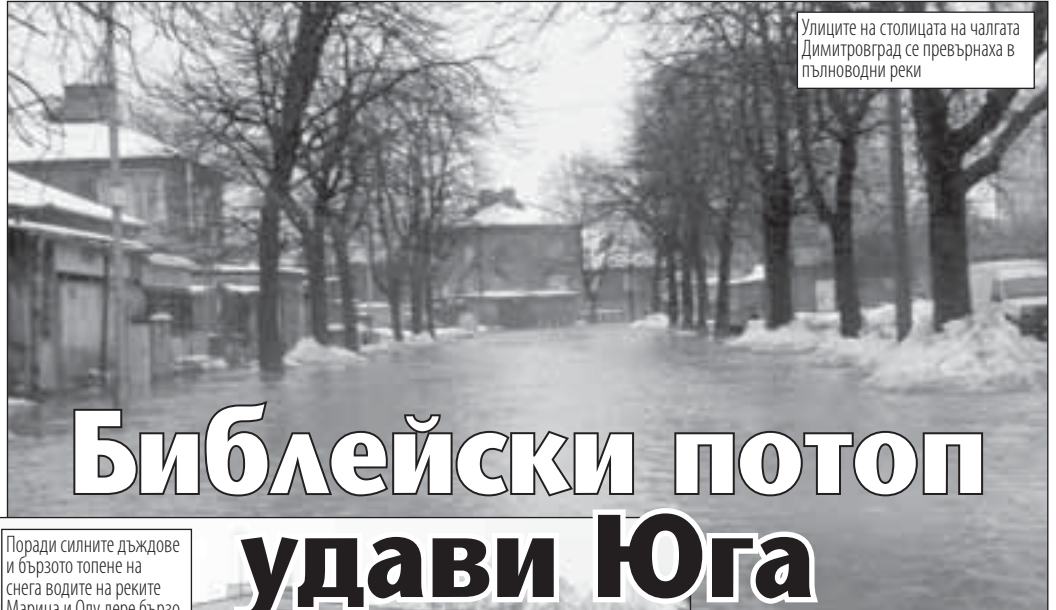
Улиците на столицата на чалгата Димитровград се превърнаха в пълноводни реки

Министър-председателят Бойко Борисов пристигна в село Бисер. По негово нареждане ви-