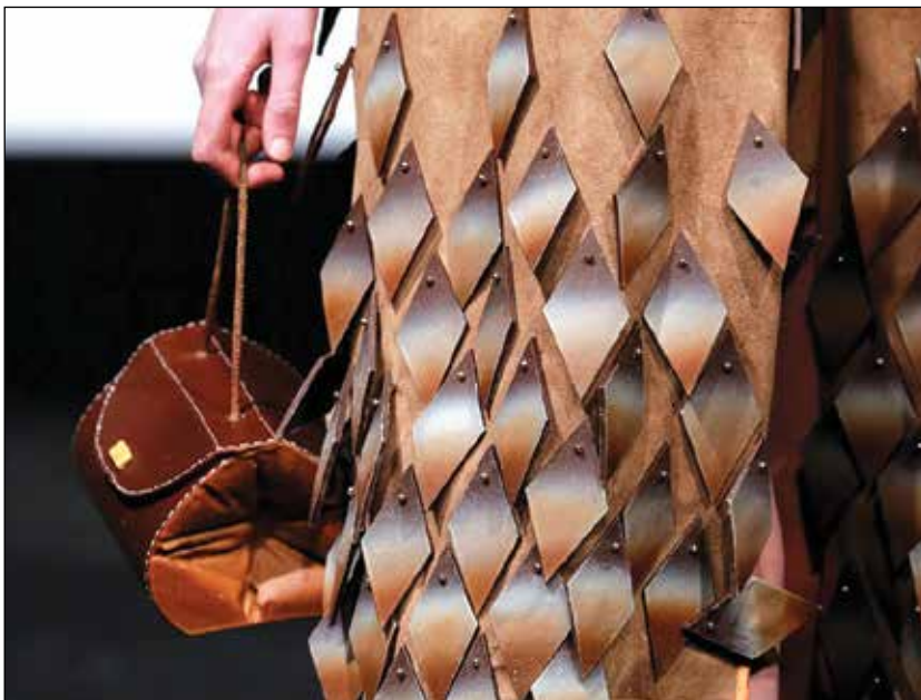
Модели представиха облекла, изработени само от сладкиши на Панаира на шоколада в Белгия