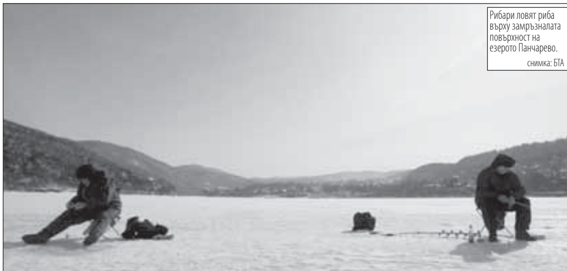
Рибари ловят риба върху замръзналата повърхност на езерото Панчарево.