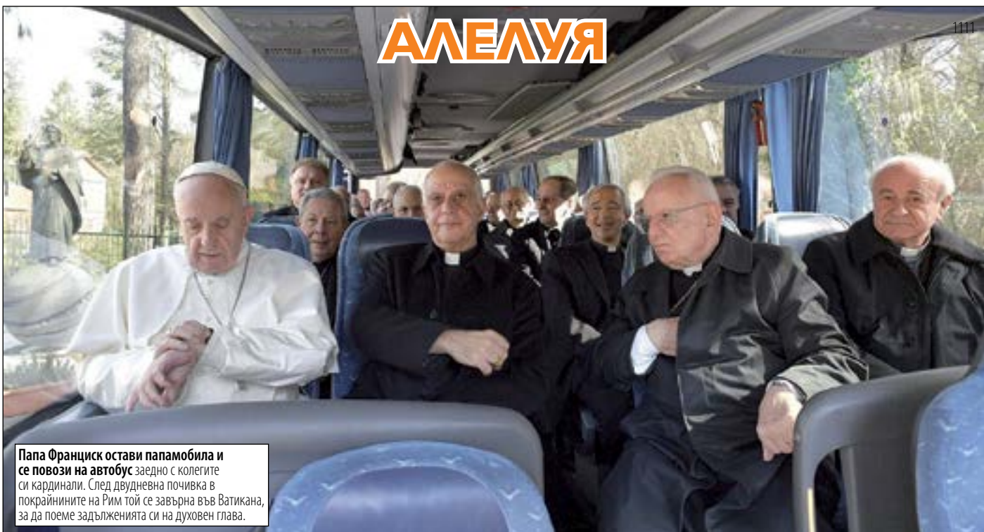
Папа Франциск остави папамобила и се повози на автобус заедно с колегите си кардинали. След двудневна почивка в покрайнините на Рим той се завърна във Ватикана, за да поеме задълженията си на духовен глава.