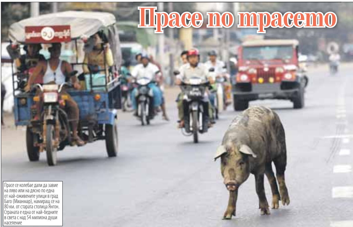
Прасе се колебае дали да завие на ляво или на дясно по една от най-оживените улици в град Баго (Мянмар), намиращ се на 80 км. от старата столица Янгон. Страната е една от най-бедните в света с над 54 милиона души население