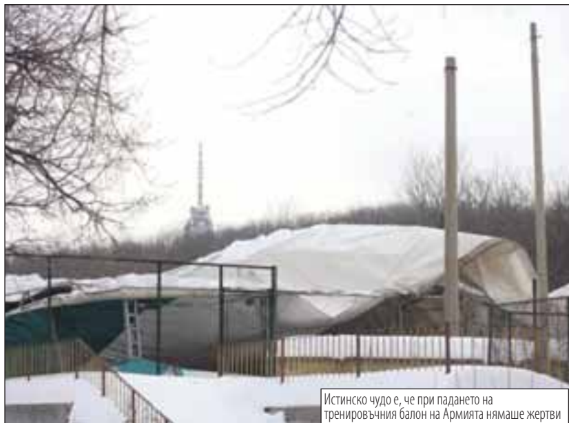
Истинско чудо е, че при падането на тренировъчния балон на Армията нямаше жертви