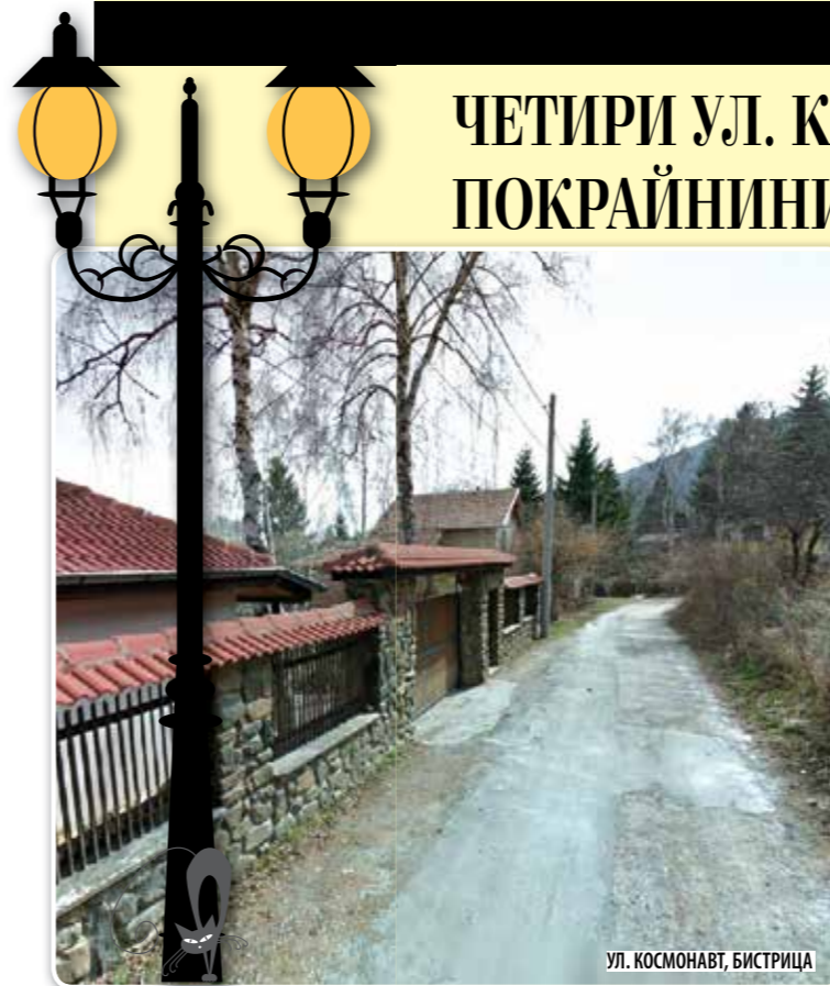
УЛ. КОСМОНАВТ, БИСТРИЦА

12 април е Денят на космонавтиката и тематично потърсихме улица в София, която увековечава вечния стремеж на човека да стигне Слънцето, още от легендарния Икар, и другите звезди. Името е Космонавт, но адресите – т.е. улиците са 4. И все са в покрайнините на града. Едната е в Бистрица, другата е в Баня, третата е в Нови Искър, а четвъртата е в също попадащото в границите на Столичната много голяма община с Доброславци. В Бистрица пътятна артерия Космонавт е пряка на възловата ул. Черни връх, а нейното продължение – кой знае защо – е наречено Синигер. Това е отдолу. Отгоре Космонавтът е заграден от ул. Върла поляна, преливаща в ул. Яновска река. В Баня Космонавт е Т-образна като „покривът“ и се вижда като змия между нищото (полето) и