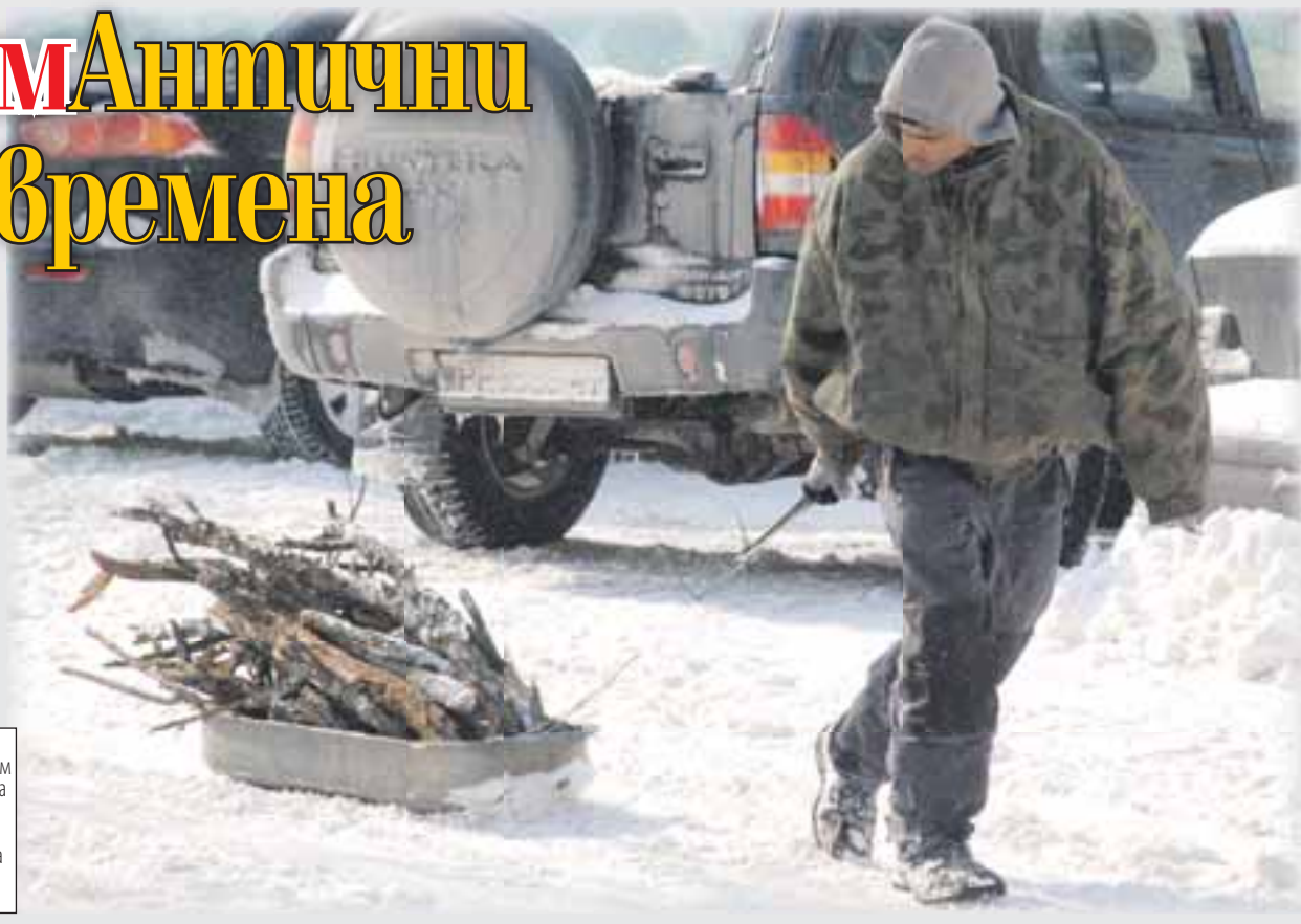
На фона на модерен джип ром от Исперих събира дребни клони в старо корито, за да зареди печката си тип Циганска любов