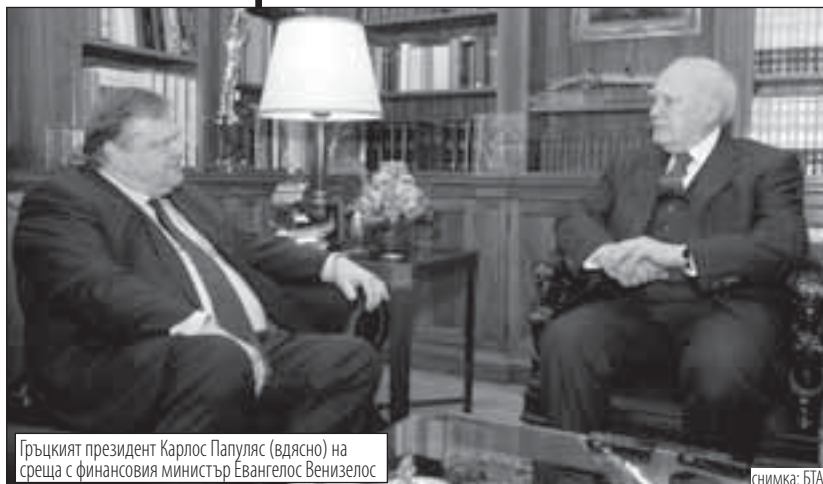
Гръцкият президент Каролос Папуляс (вдясно) на среща с финансовия министър Евангелос Венизелос

„Няколко страни-членки на еврозоната вече не искат Гърция“, заяви той след като Еврогрупата забави решението за ключовия спасителен план за разкъсването от дългове държава.