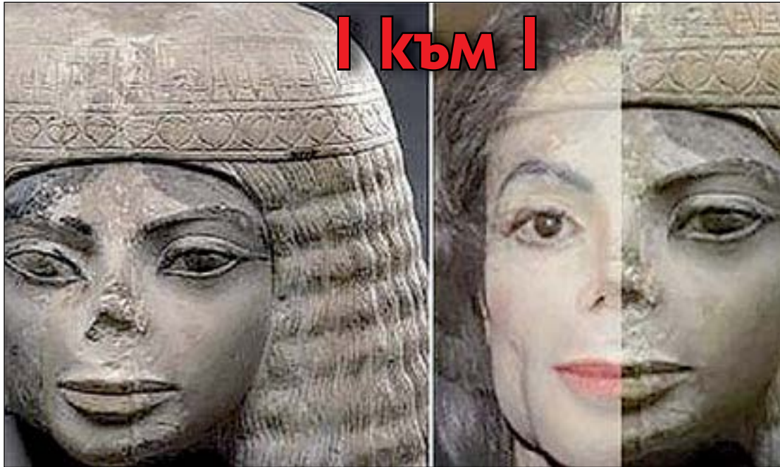
Канал в YouTube твърди, че пътуването във времето е възможно. Според Факт5 египетска статуя, която се съхранява в Музея Фийлд в Чикаго е с лицето на Майкъл Джексън.