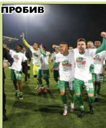
квалификационен кръг. Жребият ще бъде теглен на 19 юни.

ционни кръгове на Шампионската лига. Коефициентът на орлите през този сезон достигна 34.175 точки, което им даваше сигурно място сред поставени във втори и трети кръг, но тъй като Виктория Пилзен и Стяга не станаха шампиони на своите страни, разградчани ще са поставени дори и в плейофите. Лудогорец ще започне новата кампания в Европа на 12 или 13 юли, когато са мачовете от втория