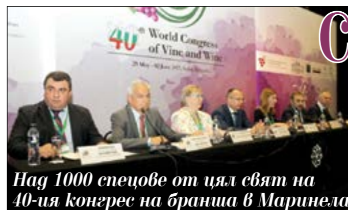
Наг 1000 спецове от цял свят на 40-ия конгрес на бранша в Маринела

За първи път България е домакин на световния конгрес по лозарство и винарство. През тази година в София е 40-ото му издание. Наг 1000 делегати от цял свят имат възможността да научат повече за българското вино. Официалното откриване на световния конгрес бе в понеделник от 11 ч. в хотел Маринела. Форумът продължава до 2 юни. Провеждането му у нас е голяма реклама за българското вино и за България. Ние сме шестият най-голям износител на вино в света, твърди Министерството на земеделието, въпреки че данните за производството всъщност ни пращат към края на втората 10-ица в класацията. Провеждането на конгреса у нас ще увеличи износа през следващата година значително. Събитие от подобен мащаб дава рядка възможност за популяризиране на българското вино и на България като винена дестинация. Гостите ще имат възможност да се запознаят и