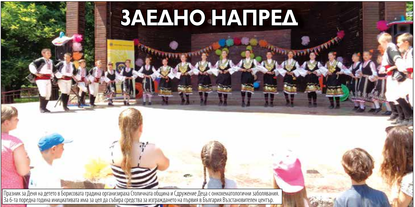
Празник за Деня на детето в Борисовата градина организираха Столичната община и Сдружение Деца с онкохематологични заболявания. За 6-та поредна година инициативата има за цел да събира средства за изграждането на първия в България Възстановителен център.