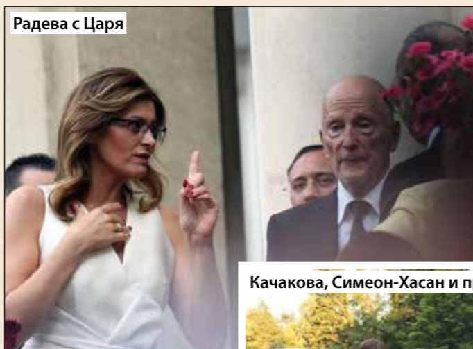
Радева с Царя