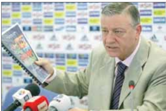
Президентът на румънската футболна федерация Мирчеа Санду разкри, че получил неприлично предложение от Българи да смени съдията на контролата Румъния - Уругвай