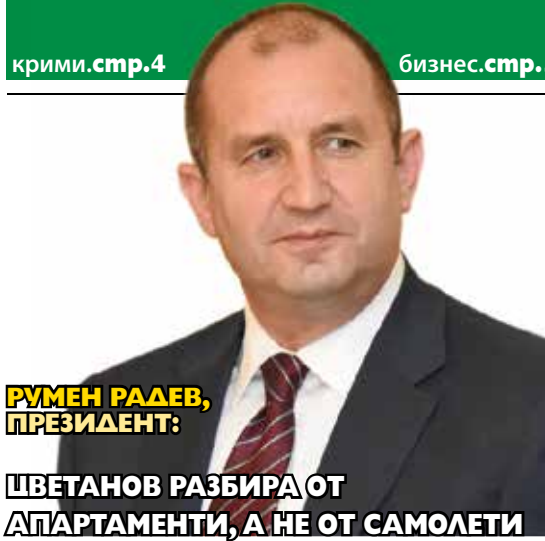
РУМЕН РАДЕВ, ПРЕЗИДЕНТ:

ЦВЕТАНОВ РАЗБИРА ОТ АПАРТАМЕНТИ, А НЕ ОТ САМОЛЕТИ