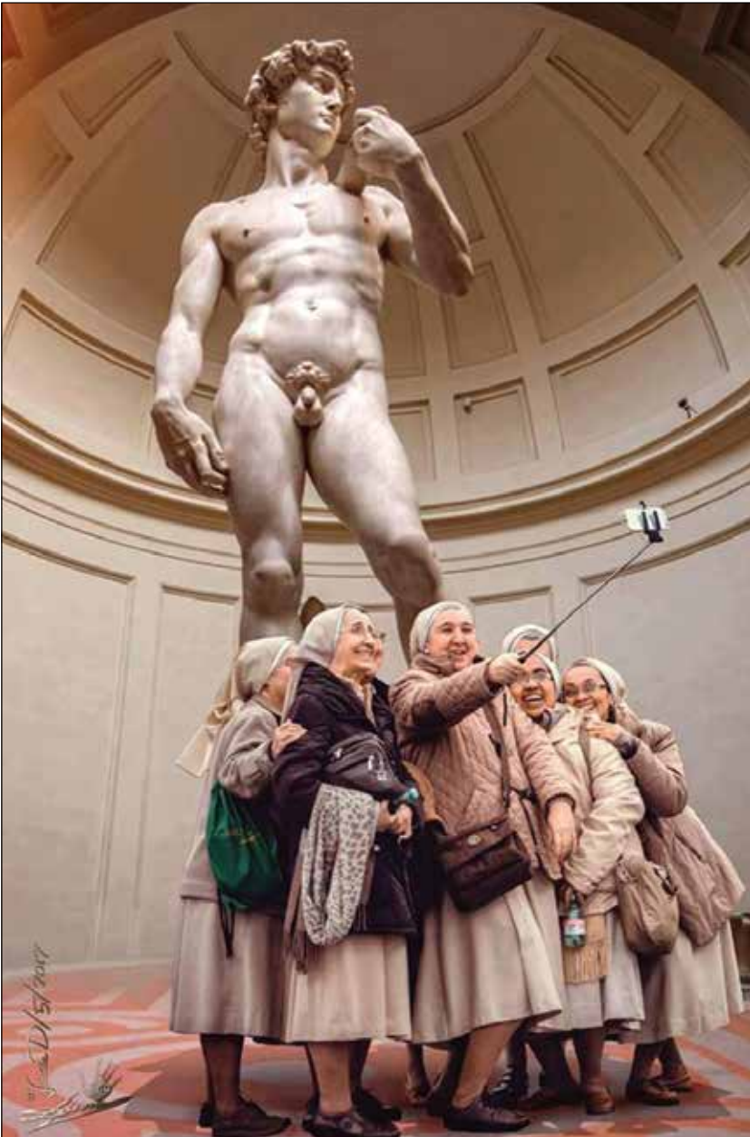
Статуята на Давид предизвиква възхищение векове наред. Група монахини си направиха селфи с голата статуя на Микеланджело в Галерията на Академията във Флоренция. Съдейки по лъчезарните усмивки на възрастните дами, можем спокойно да заключим, че произведението на изкуството не ги е засрамил с голота.