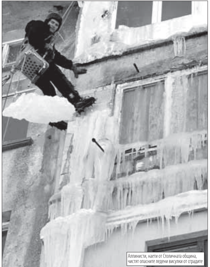
Алпинисти, наети от Столичната община, чистят опасните ледени висулки от сградите