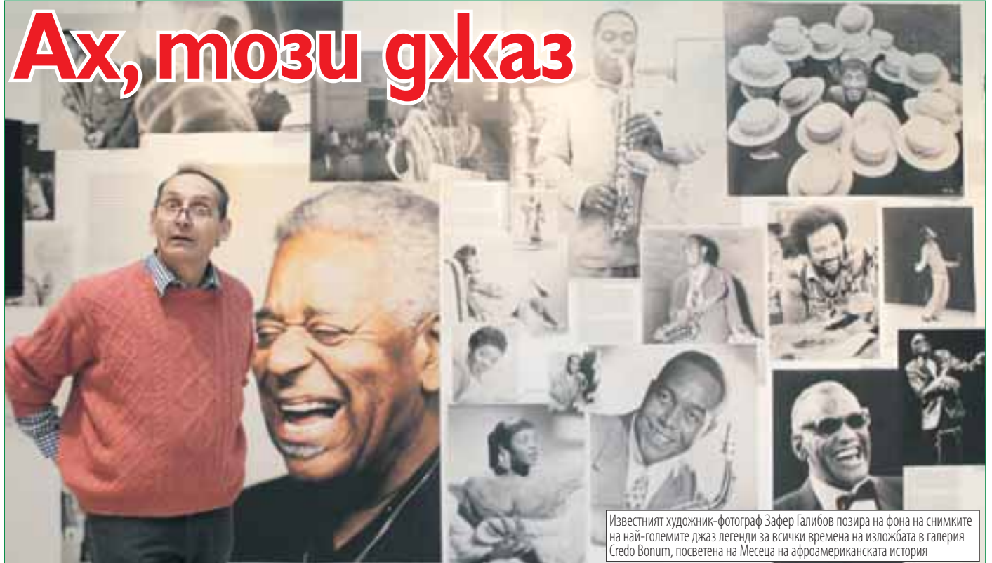
Известният художник-фотограф Зафер Галибов позира на фона на снимките на най-големите джаз легенди за всички времена на изложбата в галерия Credo Bonum, посветена на Месеца на афроамериканската история