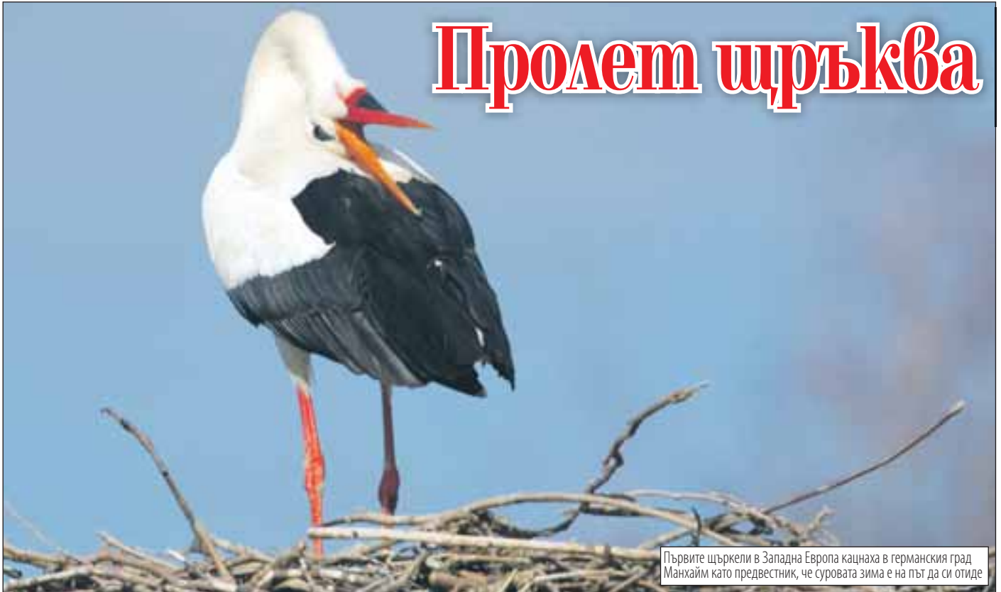
Първите щръквели в Западна Европа кацнаха в германския град Манхайм като предвестник, че суровата зима е на път да си отиде