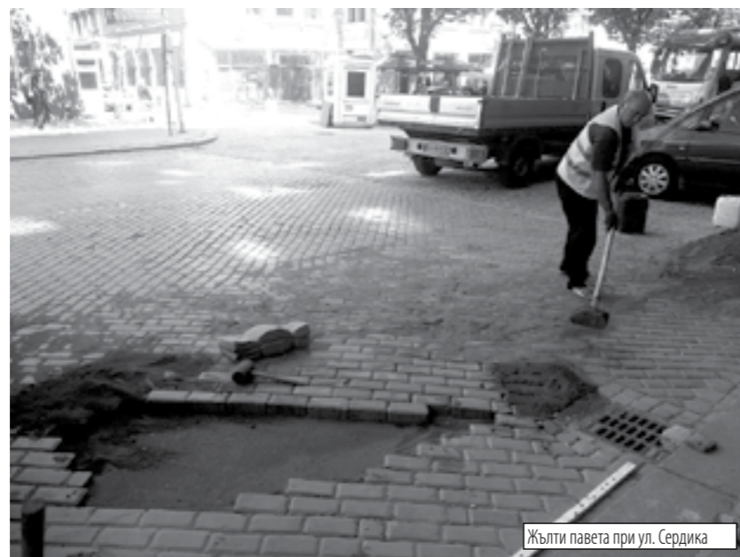
Жълти павета при ул. Сердика

На 31 август трябваше да приключи ремонтът на възловия център на София бул. Дондуков в отсечката от Ларгото до ул. Раковски, която е и най-натоварената от него. 2 седмици по-късно реконструкцията не само не е завършила, но края ѝ изглежда много далеч. Даже да бъде пуснато първо пътното платно, а след това да се прави тротоарът, в каквото положение е в момента също ремонтният със закъснение и също възлов за центъра бул. Прага. Въпреки нормалната логика, която изисква поради огромното прахово и шумно замърсяване на столицата, да се положи асфалт, малобройна гражданска организационна наложница на 2 милиона души в града да се оставят напастта. Това, раз-