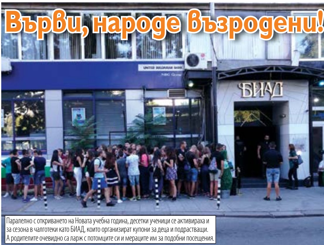
Паралелно с откриването на Новата учебна година, десетки ученици се активираха и за сезона в чалготеки като БИАД, които организират купони за деца и подрастващи. А родителите очевидно са ларж с потомците си и мераците им за подобни посещения.

стерилизират мястото на иглата? Да не умре от инфекцията ли?