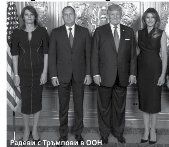
Радеви с Тръмп в ООН

България очаква приетият Закон за образованието в Украйна да не засегне по никакъв начин правата и възможностите на сънародниците ни в страната да изучават своя роден език. Това каза президентът Румен Радев на среща в Ню Йорк с украинския си колега Петро Порошенко. По време на срещата българският президент е получил уверение от киевския си колега, че в процеса на децентрализация на Украйна няма да бъдат предприемани действия за админи-