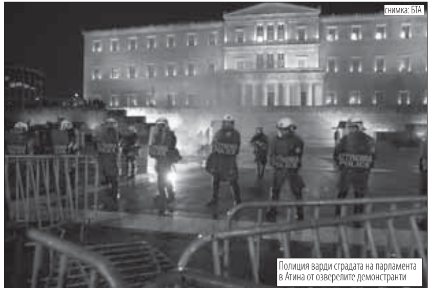
Полиция вярди сградата на парламента в Атина от озверелите демонстранти