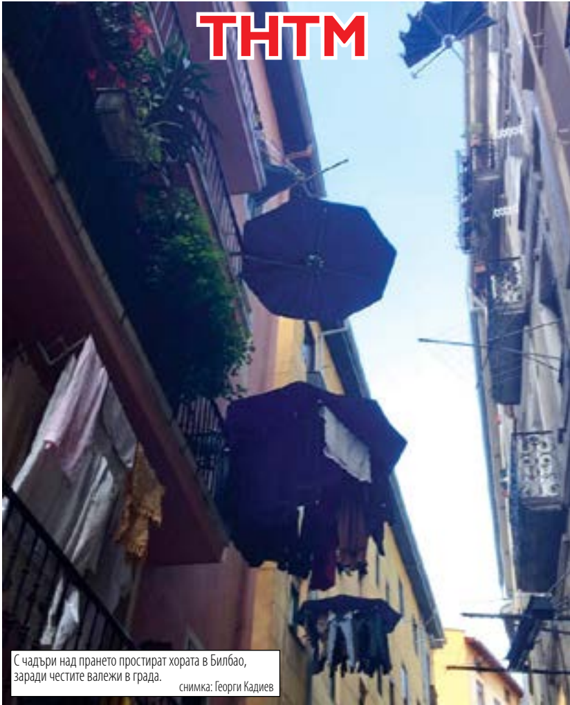
С чадъри над прането простират хората в Билбао, заради честите валежи в града.

- Какво работиш? - В държавната администрация. - А какво по-точно? - Честно, брат, не знам.