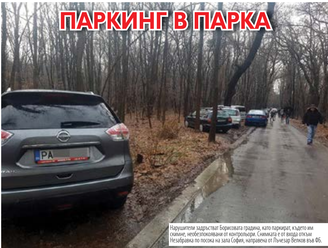
Нарушители задръстват Борисовата градина, като паркират, където им скимне, необезпокоявани от контрол्यори. Снимката е от входа откъм Незабравка по посока на зала София.