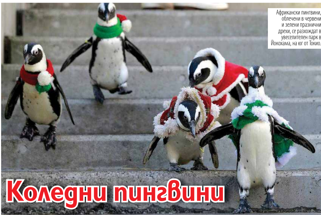
Африкански пингвини, облечени в червени и зелени празнични дрехи, се разхождат в увеселителен парк в Йокохама, на юг от Токио.