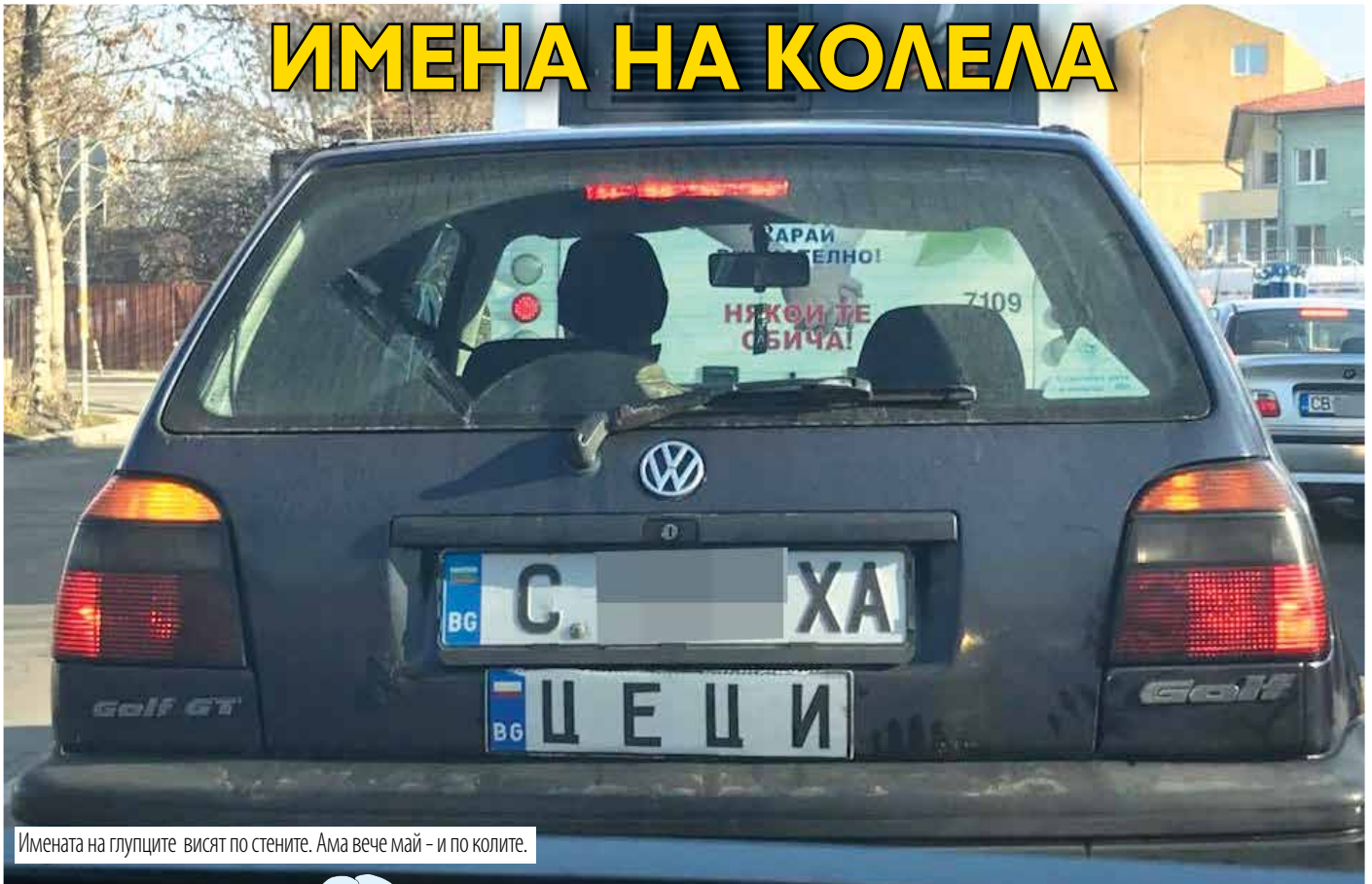
Имената на глупците висят по стените. Ама вече май - и по колите.