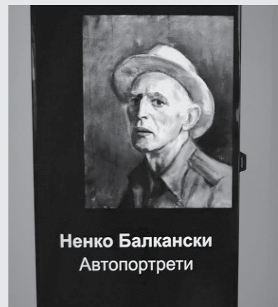
Ненко Балкански Автопортрети

СРЯДА Е ДЕНЯТ НА ОФИЦИАЛНОТО ОТКРИВАНЕ НА НАЙ-НОВИЯ МУЗЕЙ НА СОФИЯ, ПОСВЕТЕН НА ГОЛЕМИЯ БЪЛГАРСКИ ХУДОЖНИК НЕНКО БАЛКАНСКИ. ТОВА СТАВА 40 ГОДИНИ СЛЕД СМЪРТТА МУ И 110 СЛЕД НЕГОВОТО РОЖДЕНИЕ. ЕКСПОЗИЦИЯТА Е РАЗПОЛОЖЕНА В НЕГОВАТА КЪЩА НА ПРЕСТИЖНАТА СТОЛИЧНА УЛИЦА ЛАТИНКА №12 В КВАРТАЛ ИЗТОК. ПРОФЕСОРЪТ Е ПРЕДСТАВЕН ЧРЕЗ КОЛЕКЦИЯ ОТ АВТОПОРТРЕТИ, ПОКАЗАНИ МУЛТИМЕДИЙНО, ИМА МНОГО КАРТИНИ, ДОКУМЕНТИ, ТЕКСТОВЕ И СНИМКИ. РАЗКАЗАНИ СА БИОГРАФИЯТА МУ И ИСТОРИЯТА НА КЪЩАТА. НАЙ-ОРИГИНАЛНО Е РАЗГЛЕЖДАНЕТО НА КАРТИНИТЕ МУ ПРЕЗ 7 ШПИОНКИ. НАПРАВЕН Е И ДЕТСКИ КЪТ, А АТЕЛИЕТО МУ НА ВТОРИЯ ЕТАЖ СЕГА Е ЗАЛА ЗА СЪБИТИЯ. ХУДОГНИКЪТ Е СПЕЦИАЛИЗИРАЛ ВЪВ ФРАНЦИЯ И ИТАЛИЯ ВЪВ ВРЕМЕТО НА МАТИС И ПИКАСО, ОТ 1947 Г. СЛЕД ЗАВРЪЩАНЕТО СИ ПРЕПОДАВА В ХУДОЖЕСТВЕНАТА АКАДЕМИЯ, КЪДЕТО ОТ 1959 Г. Е ПРОФЕСОР ДО СМЪРТТА СИ ПРЕЗ 1977 Г.