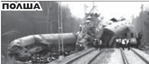
След зверския сблъсък на 6-вагонния трен, пътуващ от Пшеммиш до Варшава и 4-вагонния от Варшава до Краков, загинаха 16 души и десетки други са тежко ранени.

Най-малко 16 загинали и около 60 ранени при най-тежката влакова катастрофа от 1990 г. насам в Полша, когато загинаха 16. Трагичният сблъсък станал в района на град Шчечкочини в южната част на страната. Двата влака са се озовали един срещу друг на един и същи коловоз. Стоотици души се опитват да извадят заклещени в отломките на вагоните хора.