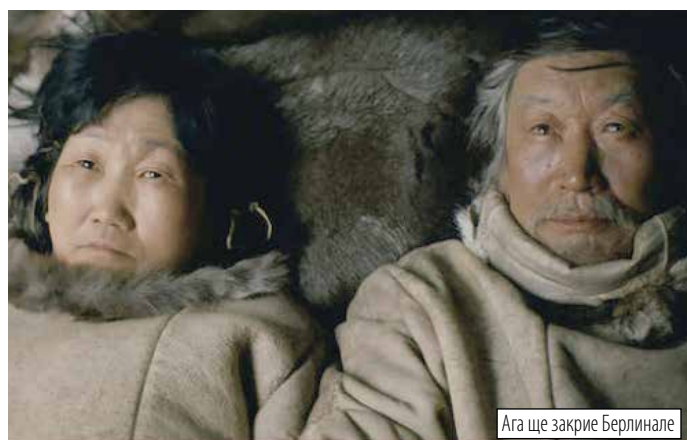
Ага ще закрие Берлинале