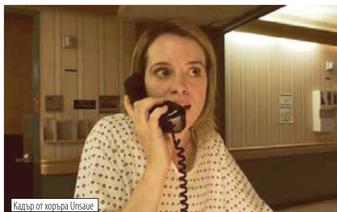
Кадър от хоръра Unsane