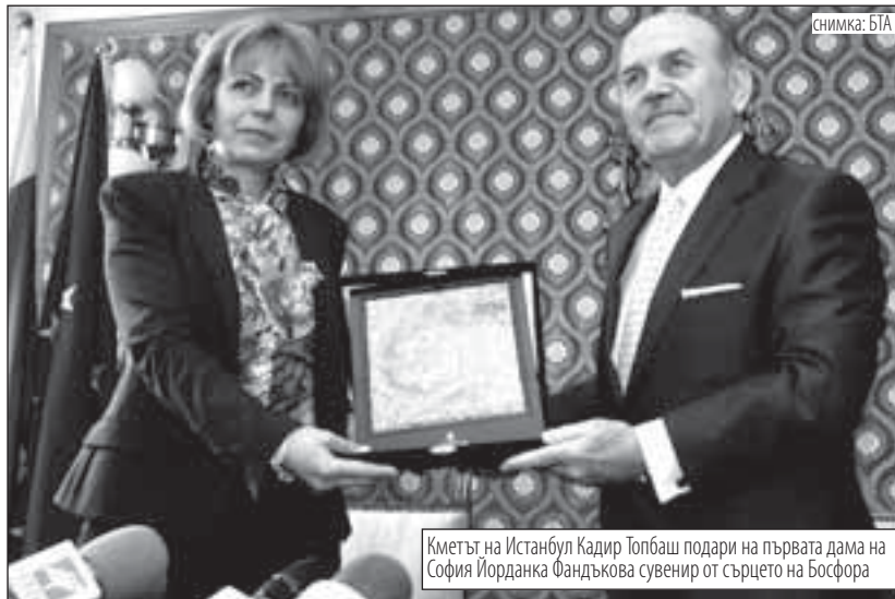
Кметът на Истанбул Кадир Топбаш подари на първата дама на София Йорданка Фандъкова сувенир от сърцето на Босфора