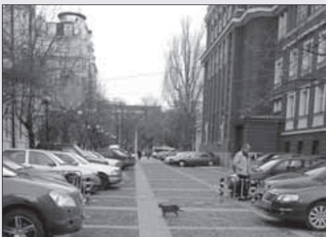
За пореден ден най-старият парк в столицата – Градската градина, е окупиран от автомобили. 19' продължава да пита до кога никои няма да прави нищо?