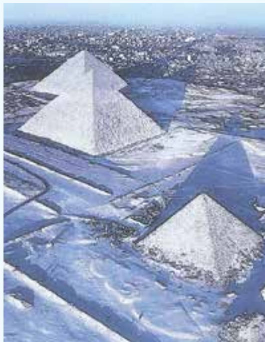
Сняг завали и над прочутите египетски пирамиди за първи път от 112 години. Обилна снежна покривка се натрупа и в прочутия френски курорт Сен Тропе.