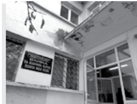
Сградата на единствената в страната Банка за майчина кърма, ще бъде напълно обновена след ремонт на стойност 800 хил. лв. Средствата са осигурени от бюджета

Стана дума и за открития амфитеатър при бул. Дондуков. Там ще бъде предприета аварийна консервация на археологическите структури, което трябва да се разпредели Министерството на културата. Обектът е блокиран от десетина години. При ремонта на Двореца от кабинета Борисов I беше зазидан и тунелът, който свързва Националната галерия с някогашната гладнаторска арена. Бяха унищожени античните останки, които съществуваха в основите на Двореца и в катакомбите, водещи към амфитеатъра. А те можеха да бъдат уникална туристическа атракция – много по-впечатляваща от пловдивския еквивалент.