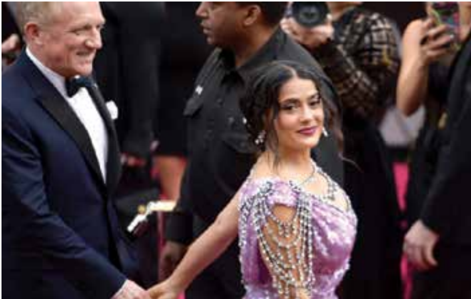
Салма Хайек сподели, че по време на Оскарите най-хубавата част от церемонията е била масажът на краката от нейния съпруг Франсоа-Анри Пино. Милиардерът, собственик на Гучи, Баленсиага и Пума определено се е постарал за комфорта на своята съпруга.