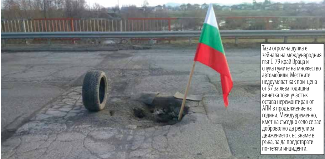
Тази огромна дупка е зейнала на международния път Е-79 край Враца и спуска гумите на множество автомобили. Местните недоумяват как при цена от 97 за лева годишна винетка този участък остава неремонтиран от АПИ в продължение на години. Междувременно, кмет на съседно село се зае доброволно да регулира движението със знаме в ръка, за да предотврати по-тежки инциденти.

тръкаляше на своето място, сега всичко е акуратно подредено някъде на майната си.