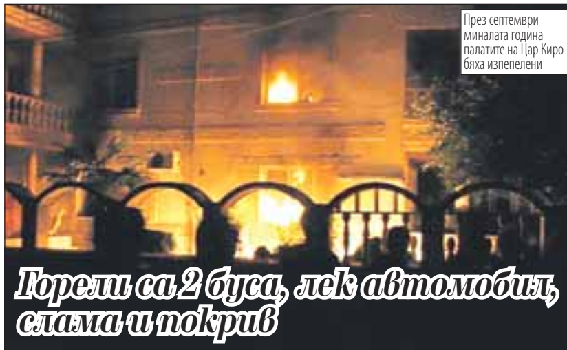
През септември миналата година палатите на Цар Киро бяха изпепелени

Порели са 2 буса, лек автомобил, слама и покрив