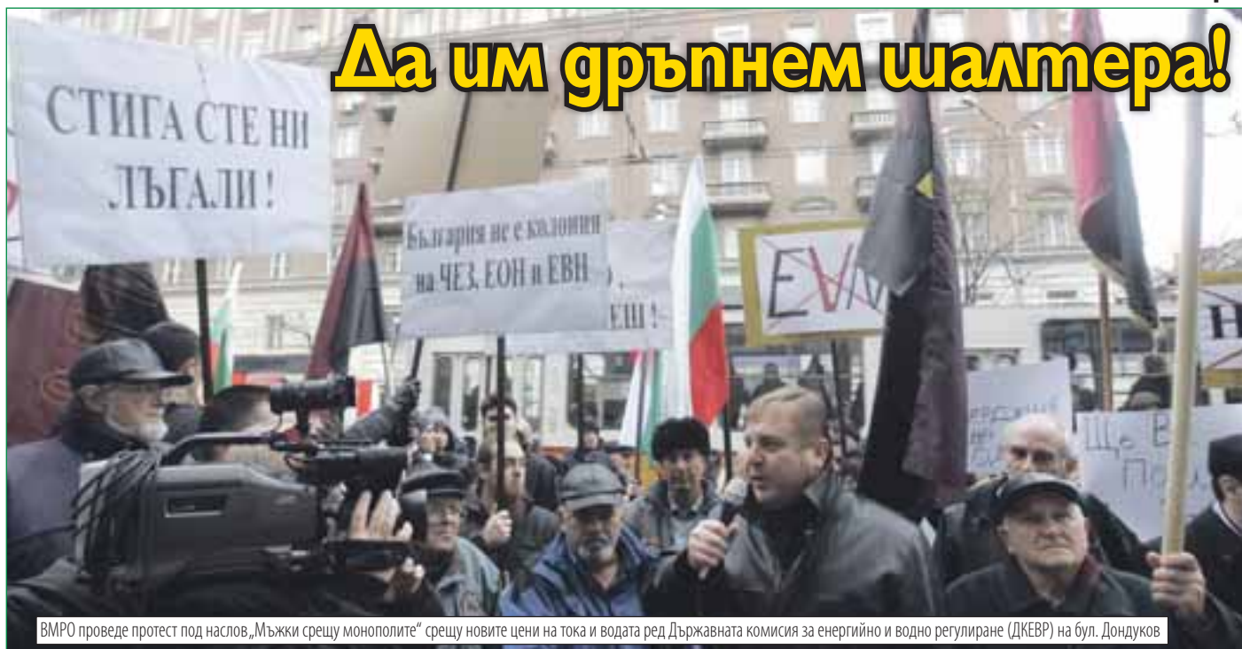
ВМРО проведе протест под наслов „Мъжки срещу монополите“ срещу новите цени на тока и водата ред Държавната комисия за енергийно и водно регулиране (ДКЕВР) на бул. Дондуков