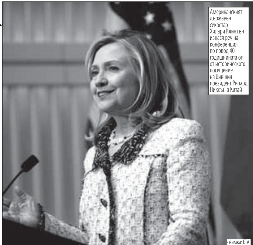
Американският държавен секретар Хилари Клинтън изнася реч на конференция по повод 40-годишнината от историческото посещение на бившия президент Ричард Никсън в Китай