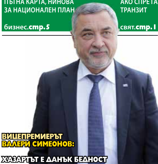
ВИЩЕПРЕМИЕРЪТ ВАЛЕРИ СИМЕОНОВ: