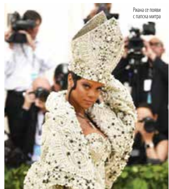
Риана се появи с папска митра