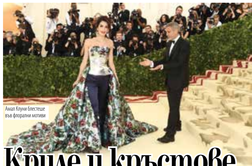
Амал Клуни блестяше във флорални мотиви