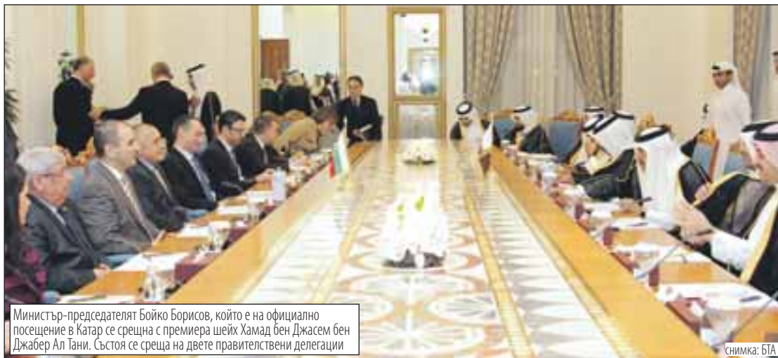
Министър-председателят Бойко Борисов, който е на официално посещение в Катар се среща с премиера шейх Хамад бен Джасем бен Джабер Ал Тани. Състои се среща на двете правителствени делегации