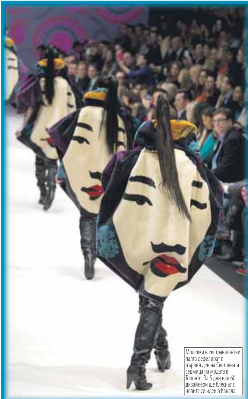
Моделки в екстравагантни палта дефилират в първия ден на Световната седмица на модата в Торонто. За 5 дни над 60 дизайнери ще блеснат с новите си идеи в Канада