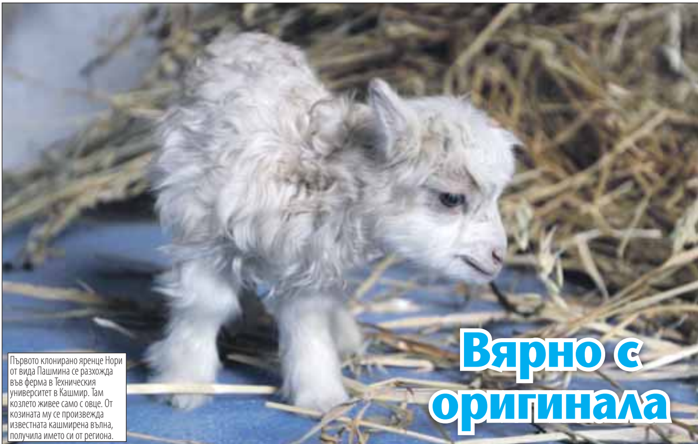
Първото клонирано яреце Нори от вида Пашмина се разхожда във ферма в Техническия университет в Кашмир. Там козлето живее само с овце. От козината му се произвежда известната кашмирена вълна, получила името си от региона.