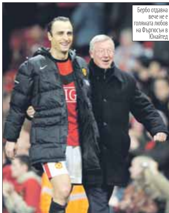
Бербо отдавна вече не е голямата любов на Фъргюсън в Юнайтед

“Бербагов може да играе срещу Атлетик (Билбао), но може и да не играе. Имам много и добри опции с нападателите. Относно ситуацията с договора му - ще го продължим. Ще се говорим с Бербагов. Той иска да играе. И ние ще трябва да обсъдим това в края на сезона. За момента Бербагов остава в Юнайтед. Ще изслушам какво