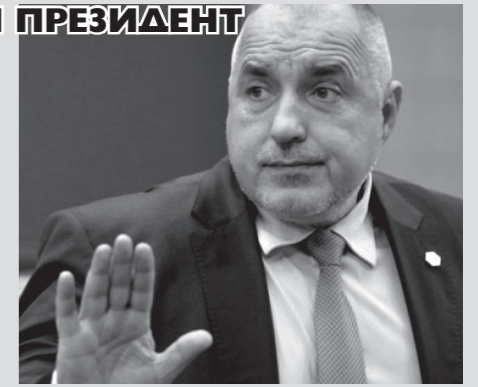
ВЪПРОСЪТ ГЛАСИ ПОЗИЦИЯТА НА МИНИСТЕРСТВОТО НА ВЪНШНИТЕ РАБОТИ. ПОСЕЩЕНИЕТО НА ГЕОРГЕ ИВАНОВ У НАС Е ПО ПОКАНА НА БЪЛГАРСКИЯ ПРЕЗИДЕНТ РУМЕН РАДЕВ.

„НЕ ИСКАМЕ ДА СЕ НАМЕСВАМЕ ВЪВ ВЪТРЕШНИТЕ РАБОТИ НА НАШАТА СЪСЕДНА ДЪРЖАВА. НАШАТА ПОЗИЦИЯ Е ПРИНЦИПНА И Е ЯСНА, КАКТО И НА ЦЯЛАТА МЕЖДУНАРОДНА ОБЩНОСТ. ЯСНА Е И ПОЗИЦИЯТА НА ПРЕЗИДЕНТА НА РЕПУБЛИКА МАКЕДОНИЯ. БЪЛГАРСКОТО ПРАВИТЕЛСТВО НЕ ВИЖДА СМИСЪЛ ДА БЪДЕ ИЗПОЛЗВАНО ВЪВ ВЪТРЕШНО-ПОЛИТИЧЕСКИТЕ ДЕБАТИ В СКОПИЕ. КЛЮЧОВА ЗА БЪДЕЩЕТО РАЗВИТИЕ НА НАШАТА СЪСЕДНА ДЪРЖАВА Е ИНТЕГРАЦИЯТА В ЕС И НАТО И ТЯ НЕ БИВА ДА БЪДЕ ПОСТАВЯНА ПОД