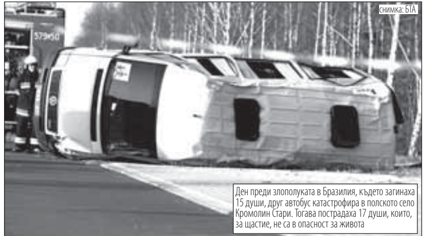
Ден преди злополуката в Бразилия, където загинаха 15 души, друг автобус катастрофира в полското село Кромолин Стари. Тогава пострадаха 17 души, които, за щастие, не са в опасност за живота