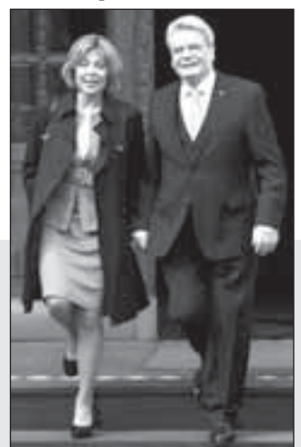
Кандидатът за президент на Германия Йоахим Гаук заедно с приятелката си 52-годишната журналистка Даниела Шат, с която има връзка от години

В събота пък автобус, превозващ 19 пътници, повечето от които тинейджъри, се е сблъскал с автомобил Тойота Ярис в Полша, при което са били ранени 16 души. Катастрофата е станала в близост до село Кромолин Стари, в централната част на страната.