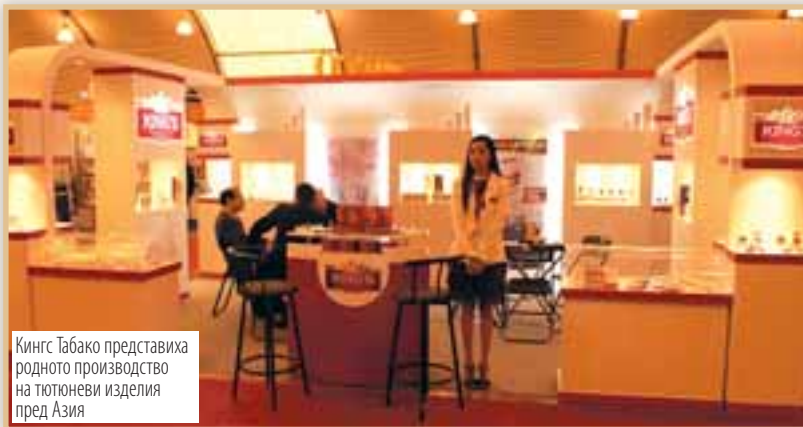
Кинг Табако представиха родното производство на тютюневи изделия пред Азия