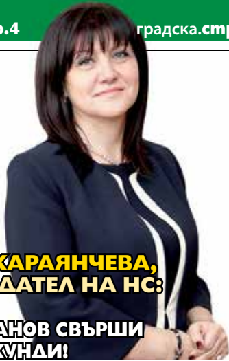
ЦВЕТА КАРАЯНЧЕВА, ПРЕДСЕДАТЕЛ НА НСРФ: