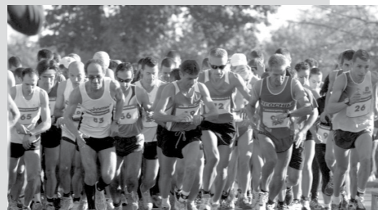
НАГРАДИ ЩЕ ИМА И ЗА ВСИЧКИ ДО ШЕСТОТО МЯСТО НА 21 КМ И НА 10.5 КМ.

РЕГИСТРАЦИЯТА ПРОДЪЛЖАВА ДО 7 ОКТОМВРИ. НАГРАДНИЯТ ФОНД Е 60 000 ЛЕВА, КАТО ШАМПИОНИТЕ ЩЕ ПОЛУЧАТ ПО 8000 ЛЕВА. ПАРИЧНИ