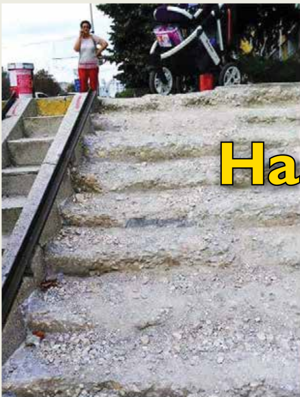
ВАРНА - 2018 г. стълби на подлез при спирка „Явор“