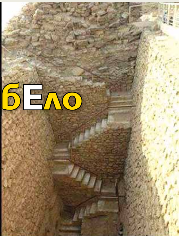
ЕГИПЕТ - 2650 г. пр. Хр. стълби към южен вход на пирамидата на Джосер