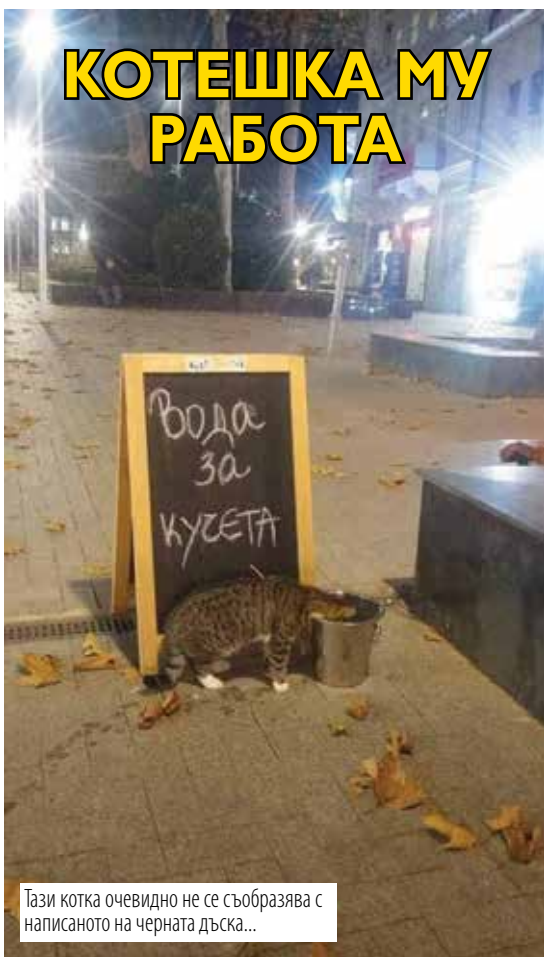
Тази котка очевидно не се съобразява с написаното на черната дъска...