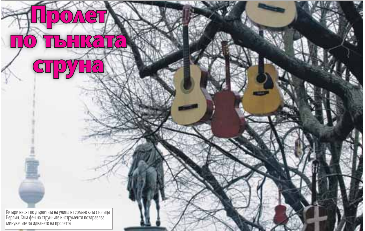
Китари висят по дърветата на улица в германската столица Берлин. Така феновете на струнните инструменти поздравяват минавачите за идването на пролетта