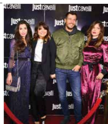
НОВИЯТ БУТИК НА JUST CAVALLI В СОФИЯ ОТБЕЛЯВА ОТКРИВАНЕТО СИ С МОДНО ДЕФИЛЕ И ИЗИСКАН КОКТЕЙЛ.