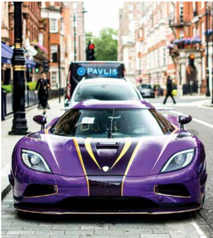
Представяме Ви Koenigsegg, чиято базова цена, без екстри е $ 2 000 000, а този специален рядък лилав модел на автомобила струва $ 4 000 000.