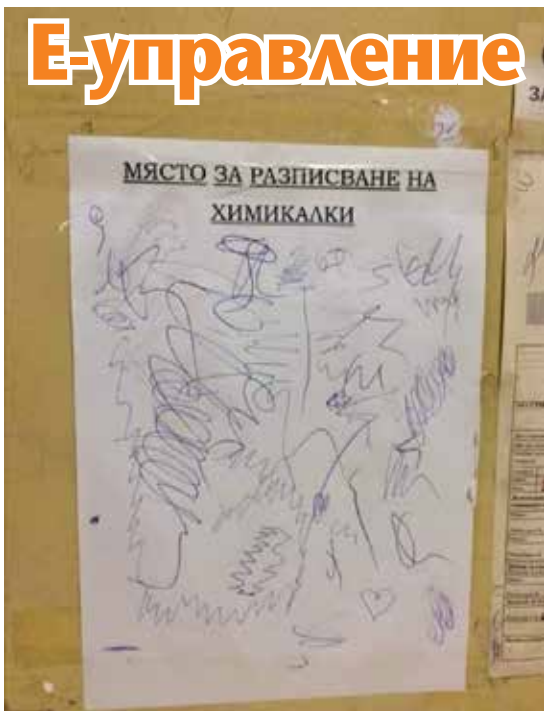
На такива гледки може да стане свидетел човек, ако си има работа с администрацията ни в 21-век, през 2018-а година.

- Ще умрете самотен в мизерия и ще страдате жестоко.