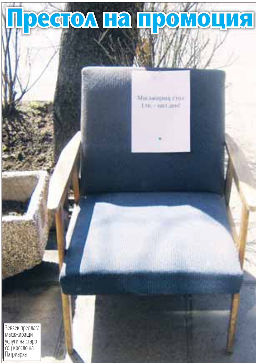
Зевзек предлага масажиращи услуги на старо соц кресло на Патриарха

>>ВСЕКИ 3-И МЪЖ Е АЛКОХОЛИК, ВСЯКА 10-А ЖЕНА СЕ НАЛИВА ОТ ОТЧАЯНИЕ