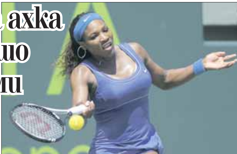
Напращаля отвсякъде и с издйайническо любовно сърчице от сребро на шията, така Серена Уилямс, която е свързана в любовна афера с 10 години по-младия от нея Григор Димитров, показва суперформа на кортовете на Грандън парк в Кей Бискейн (Флорида) на турнира Сони Ериксон Оупън, известен като Маями Мастърс

Б ившата №1 в тениса Серена Уилямс беше сред малкото зрители на трибуните по време на историческата победа на Григор Димитров над 7-ия в света Томаш Бердих (Чех) от 5-ия кръг на Мастърса в Маями (САЩ). Както е известно, 20-годишният хасковлия разпра чеха с 6:3, 2:6, 6:4 и така за първи път записа успех над представител от Top 10. Едрогабаритната, такава Серена (50), която също е убедителна в женския поток на турнира, очевидно много се вълнуваше при всяко отиграване на нашия, с когото преди 2 месеца в любовна афера я заподозря таблоидът Ню Йорк Пост.