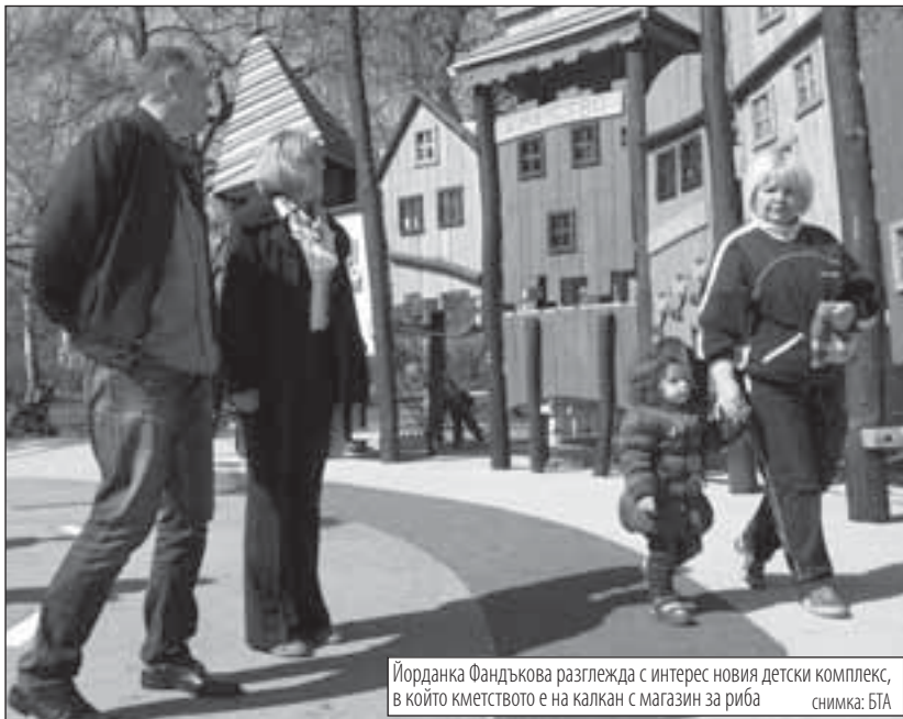
Йорданка Фандъкова разглежда с интерес новия детски комплекс, в който кметството е на калкан с магазин за риба

„Миналата година започнахме строителство на площадки