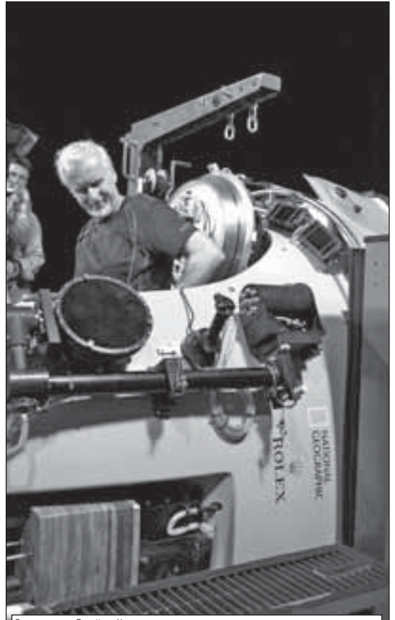
Режисьорът Джеймс Камерън се подготвя да се гмурне до дъното на Марианската падина. Потопяването е част от съвместната научна експедиция на Камерън с Нешънъл Джогеографик и Ролекс

Целта на режисьора е документален филм. Експериментът му има и сериозна науч-