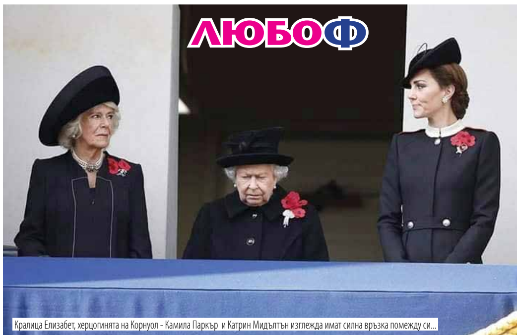
Кралица Елизабет, херцогинята на Корнуол - Камила Паркър и Катрин Мидълтън изглежда имат силна връзка помежду си...