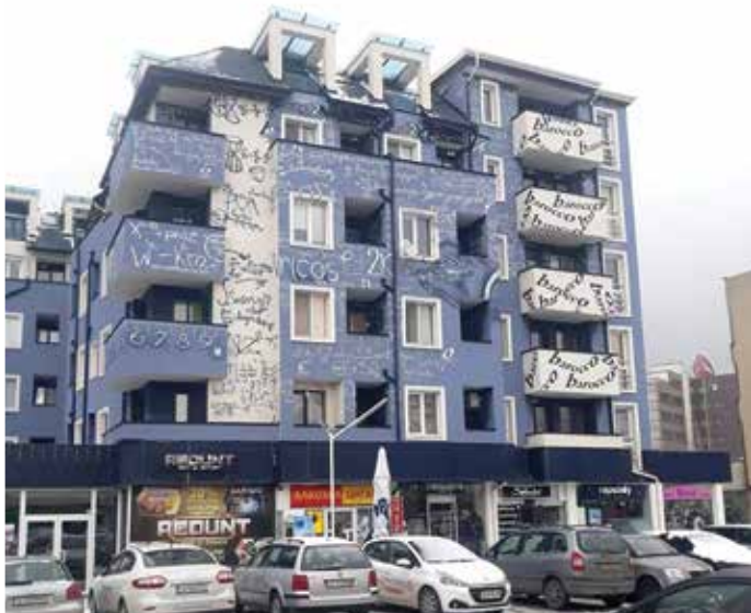
Този блок в Студентския град е оригинално пременен с математически формули като barosso – необработен диамант.